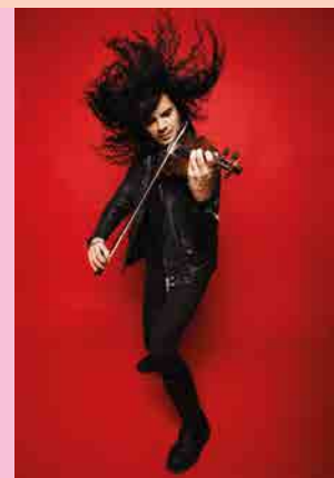
Nemanja Radulovic © Charity Artiste 100 This photo may be covered with the photographer's copyright © The name of Deutsche Grammophon must be mentioned when the work is being used in any form.